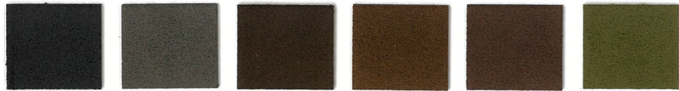
5788 Charcoal 5789 Graphite 3147 Coffee Bean 3889 Brownstone 3913 Branch * 4341 Moss