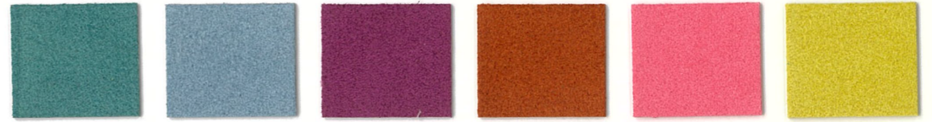
7142 Real Teal 2756 Horizon 9480 Orchid * 8224 Canyon 6659 Pink Ribbon * 4577 Citron