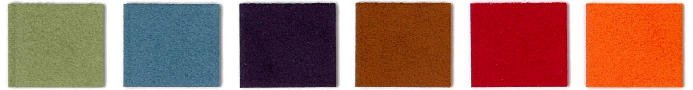
4484 Fern 2754 Malibu 9391 Amethyst 8175 Clay 1304 Scoundrel 8223 Orange