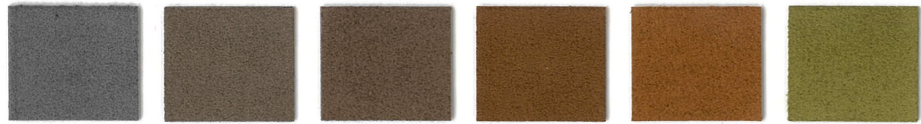
5971 Deep French Grey 3367 Elephant 3274 Beaver 3588 Hide 3585 Curry 4485 Cactus