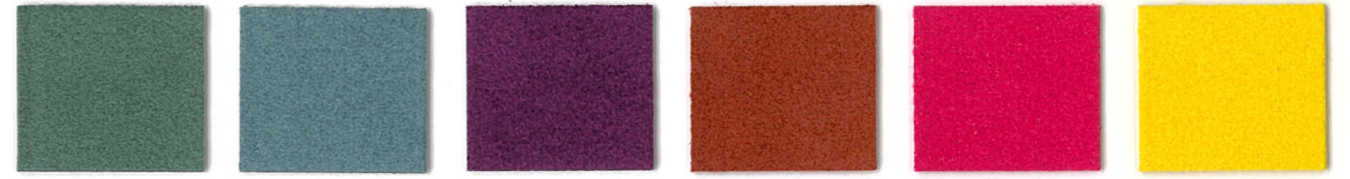
4397 Eucalyptus 2679 Moonstone 9393 Wild Plum 8201 Roasted Pepper 6628 Hot Pink 5283 Sunshine