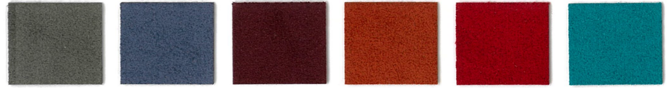
4396 Sage 2329 Steel Blue 1155 Burgundy 8253 Terracotta 1334 Tomato 7389 South Beach