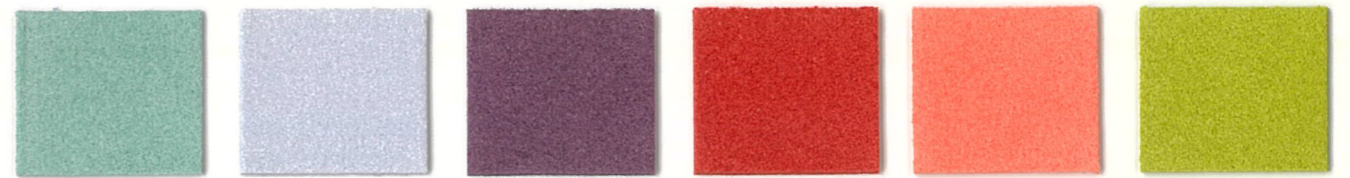
4147 Opalene 5515 Cadet Grey * 9441 African Violet 1454 Sienna * 6661 Sunset * 4488 Lime