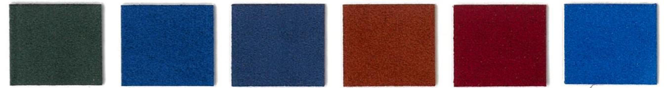
4342 Shetland 2328 True Blue 2539 Baltic 3586 Terra 1401 Madeira 2530 Regal Blue