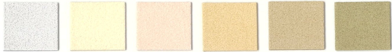
5969 Fog 3424 Chablis 6660 Champagne * 3694 Ivory 3280 Chamois 3281 Camel