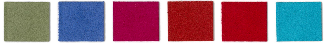
4504 Willow 2323 Periwinkle 6496 Wine'n Roses 1364 Navajo Red 1367 Red 7397 Robin's Egg *