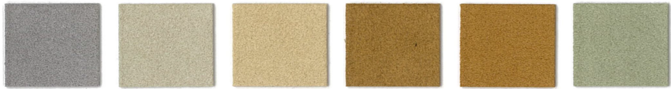
3271 Taupe 3279 Sandstone 3584 Sand 3093 Spice 5206 Ginger 4483 Mystic