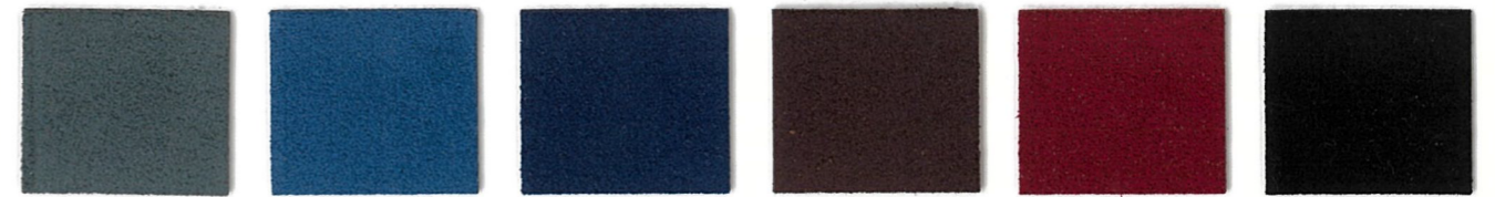
2680 Slate Blue 2755 Brittany 2330 Indigo 3890 Teakwood 1240 Mulberry 5709 Black Onyx