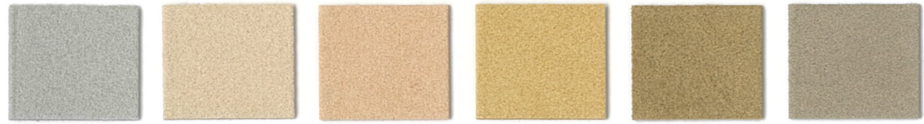
5810 Platinum 3583 Bisque 3911 Nude * 3696 Wheat 3092 Sahara 3914 Pebble *