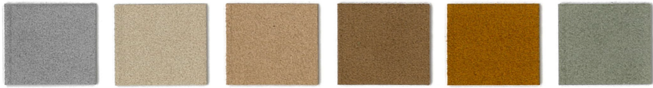
5970 French Grey 3916 Doeskin 3697 Mica 3888 Desert Camel 5207 Cumin 4398 Lichen