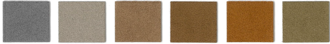
5566 Pewter 3366 Stone 3282 Fawn 3912 Maple Wood * 3891 Aztec 3918 Peat